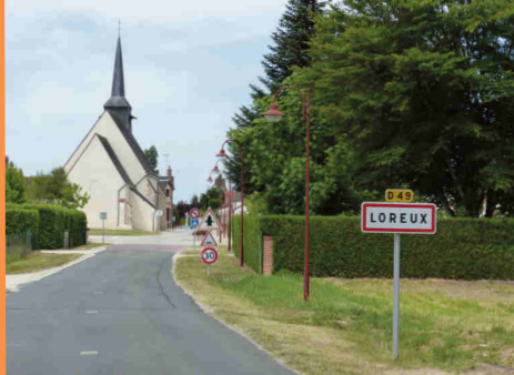
Entrée du bourg de Loreux.